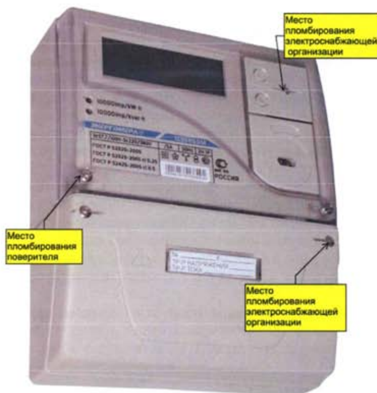
Рисунок 5 – Общий вид счетчика ЦЭ6850М ШЗ1