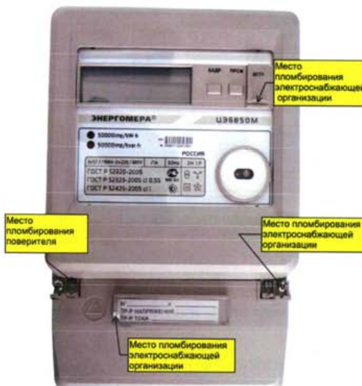
Рисунок 4 – Общий вид счетчика ЦЭ6850М Ш30