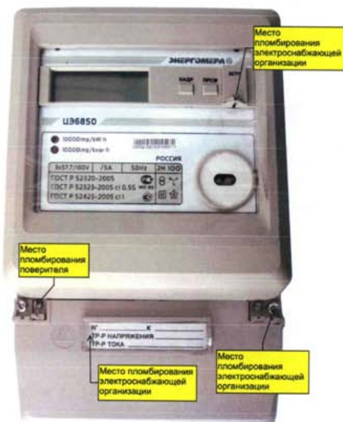
Рисунок 3 – Общий вид счетчика ЦЭ6850